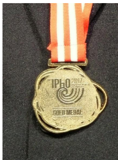
Obr. 2 - Zlatá medaila