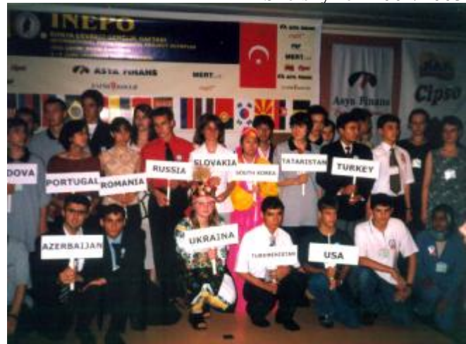
Z medzinárodnej olympiády environmentálnych projektov - Turecko, Istanbul, 2.-5. jún 2002