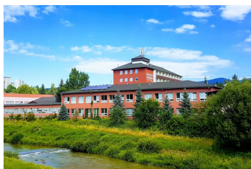
Hotelová akadémia J. Andraščíka, Bardejov