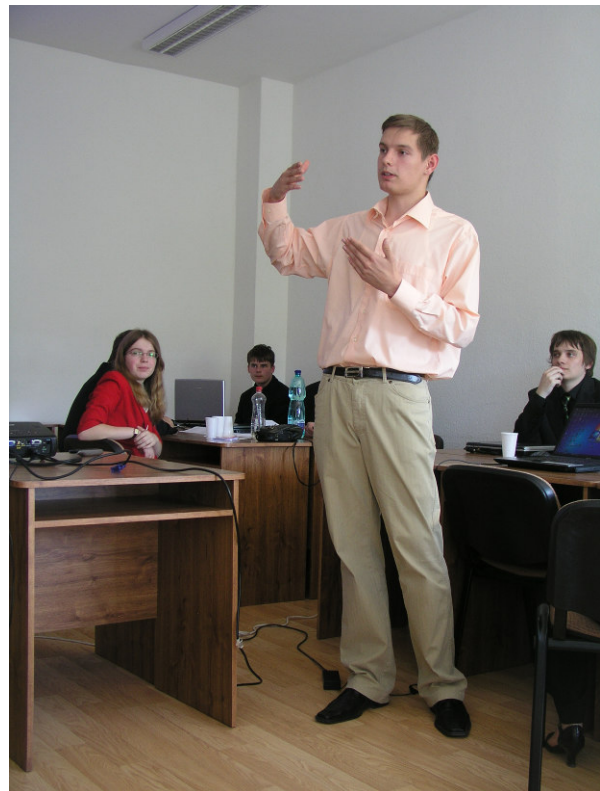
Zanietená diskusia medzi porotcom a súťažiacim

Pred ukončením Celoštátneho kola Turnaja mladých fyzikov ešte Odborná komisia TMF v spolupráci s vedúcimi tímov vybrala reprezentačný tím, ktorý bude reprezentovať