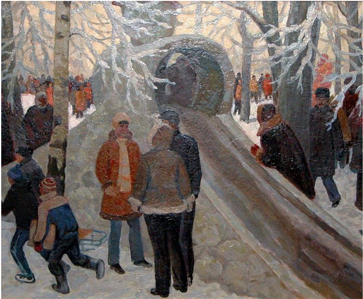
Щелоков Вячеслав Гаврилович (1934) "Встреча у ледяной горки"