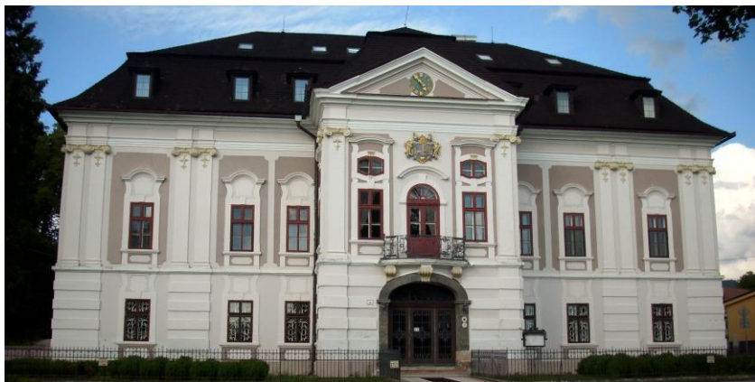
A képen a mosóci/Mošovce kastély látható.

21. A válaszlapon jelöld meg (karikázd be), hogy találkozhattak-e, egymással vagy nem, történelmünk alább felsorolt személyiségei.