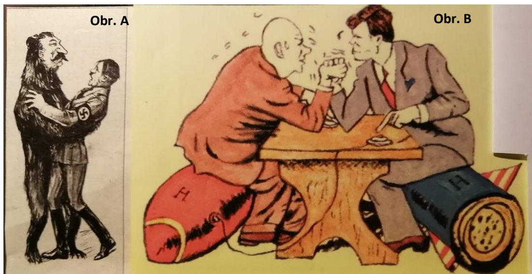
Obr. 5 – karikatúry

Do Odpovedového hárku napíšte názvy štátov, ktorých reprezentanti riešia udalosť/situáciu zobrazenú na karikatúrach. Uvedte tiež, aké konkrétne udalosti/situácie zobrazujú karikatúry.