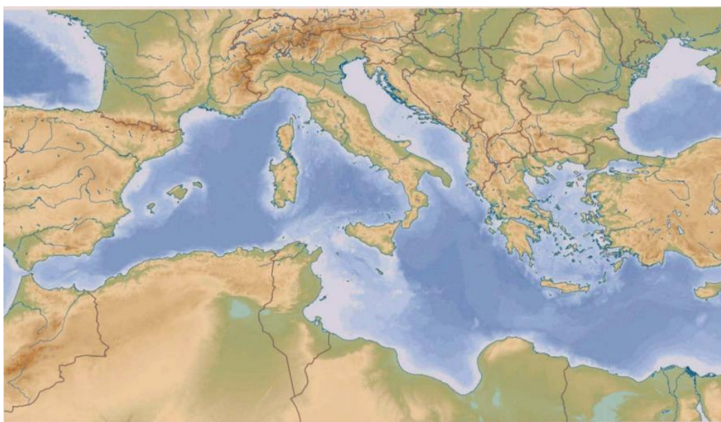
Obr. 1 – mapa Stredomoria

Už starovekí Gréci rozvíjali obchod najmä s olivami, olivovým olejom, vínom a predstavili sa svetu ako veľkí kolonizátori okolitých území. Ukončili tak veľkou kolonizáciou (800 – 550 pred Kr.) obdobie temna. Grécke osídlenie sa rozšírilo takmer po celom Stredomorí a Čiernomorí - kolonizovali Krym, sever Čierneho mora, južné Taliansko, Sicíliu a smerom na západ až po Mesaliu/Marseille.