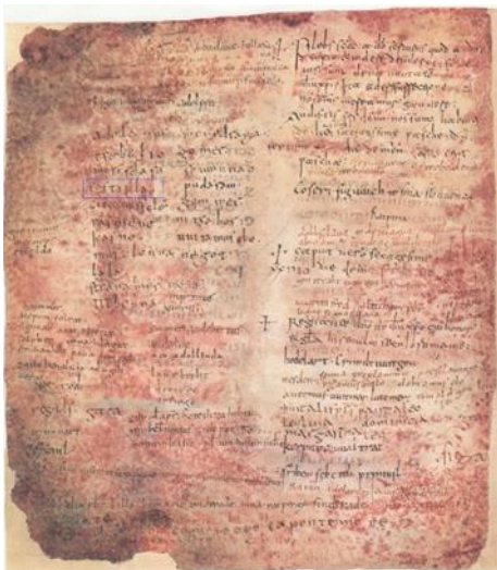
Obr. 2 - Z Cividalského evanjeliára

2. Historické pramene sú v rukách historika základným zdrojom poznania. Poskytujú mu dôkazy pri skúmaní minulosti. Našimi hlavnými zdrojmi informácií pred vynálezom kníhtlače sú rukopisy. Väčšinou ich napísali mnísi v kláštorech. Jedným z nich je aj Cividalský evanjeliár zo 6. storočia, ktorý sa nachádza v kláštore v talianskom Cividale del Friuli. Spomínajú sa v ňom aj mená Pribina, Kocel, Rastislav, Svätopluk a i. Dnes vieme, že je len jedným z mnohých prepisov. Jeho mimoriadny historický význam však spočíva v marginálnych zápisoch mien významných návštevníkov spomínaného kláštora. Vznik zápisov mien veľkomoravskej a panónskej proveniencie možno v podstate datovať na počiatok druhej polovice 9. storočia. Zápisy nasvedčujú tomu, že významní návštevníci používali kláštor ako vhodné miesto na odpočinok po dlhých cestách smerujúcich hlavne do Ríma a Benátok.