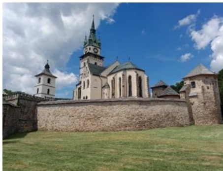
Na obrázku je hrad v Kremnici.

22. Koncom stredoveku, v roku 1514, sa v Uhorsku objavil takzvaný „sedliacky kráľ“, ktorý však nemal šťastný osud, lebo bol vodcom nakoniec neúspešného povstania.