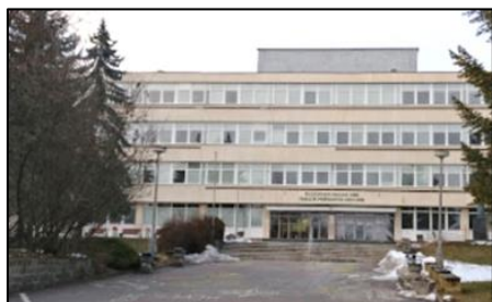
Fakulta prírodných vied UMB