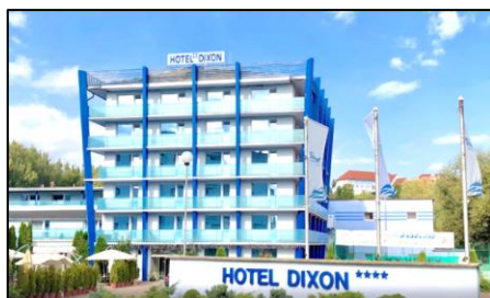
Hotel Dixon Zdroj mapy a foto: Google