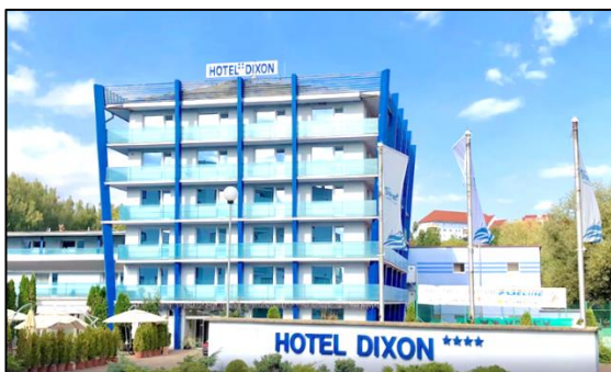
Hotel Dixon Zdroj mapy a foto: Google