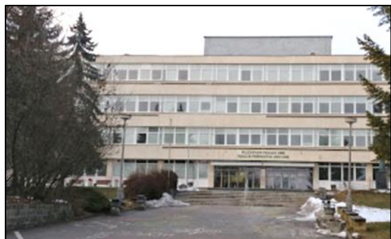
Fakulta prírodných vied UMB